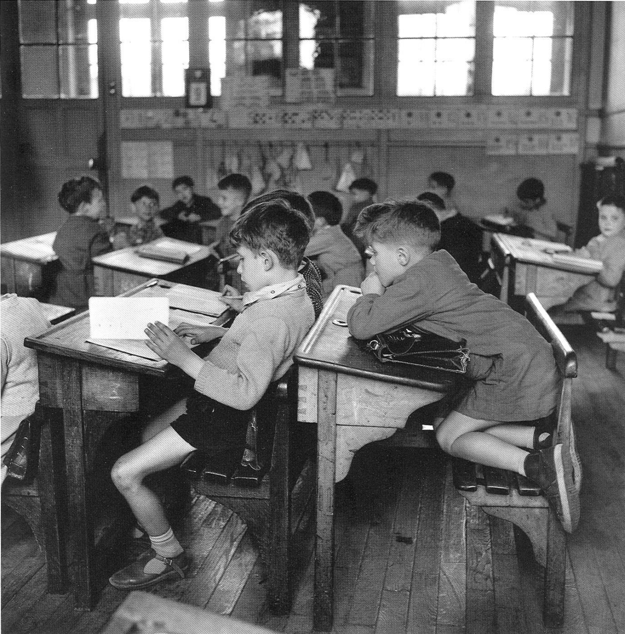
Robert Doisneau (1957)